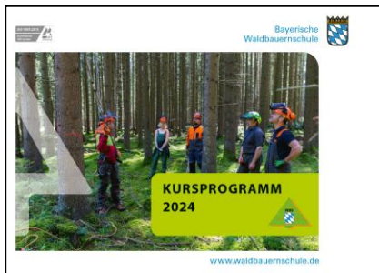
Titelbild Kursprogramm 2024

Der Freistaat Bayern investiert gezielt in die Fortbildung von Waldbesitzerinnen und Waldbesitzern und ermöglicht ihnen dadurch eine vergünstigte Kursteilnahme. Denn eine aktive, unfallsichere Pflege und Bewirtschaftung der Wälder dient auch dem Gemeinwohlinteresse.